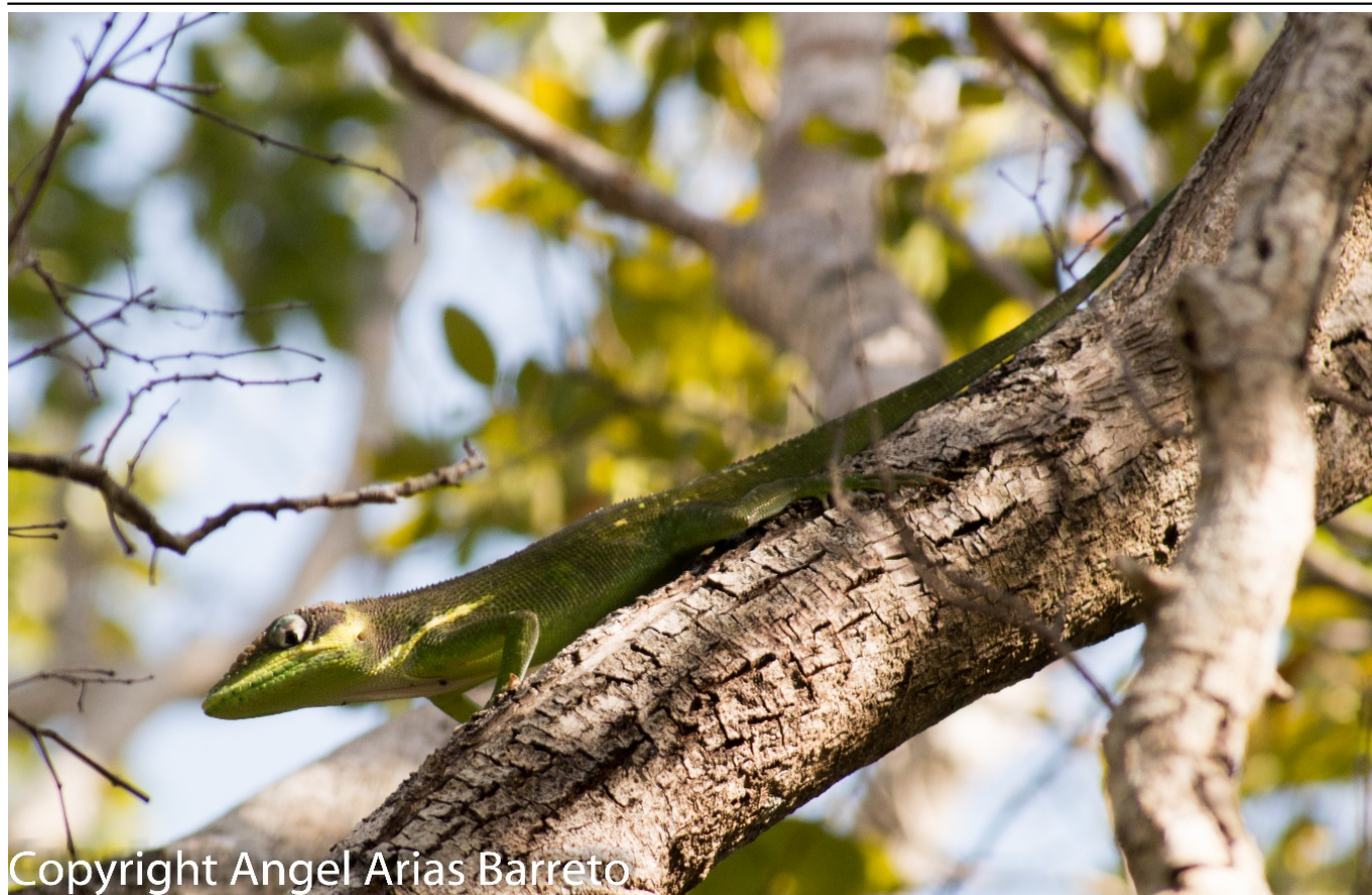
Foto del Chipojo Enano de Cayo Francés

En cuanto a la flora, hasta la fecha se registran en la base de datos del CESAM VC 2323 taxones vegetales. De estos, 97 están identificados hasta género y no constituyen un aporte a la lista florística de la provincia. Por tanto, de acuerdo con los datos compilados hasta el momento, la provincia cuenta con un total de 2226 especies vegetales, pertenecientes a 918 géneros de 195 familias. Estos resultados no son definitivos debido a que no incluyen los registros contenidos en las libretas sabias del herbario ULV para algunos municipios.