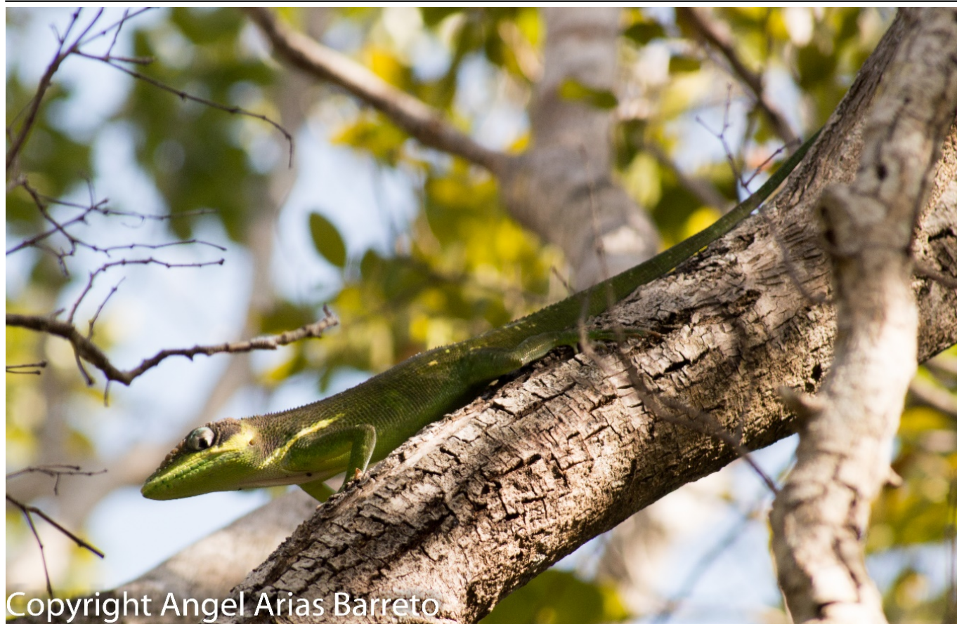
Foto del Chipojo Enano de Cayo Francés

En cuanto a la flora, hasta la fecha se registran en la base de datos del CESAM VC 2323 taxones vegetales. De estos, 97 están identificados hasta género y no constituyen un aporte a la lista florística de la provincia. Por tanto, de acuerdo con los datos compilados hasta el momento, la provincia cuenta con un total de 2226 especies vegetales, pertenecientes a 918 géneros de 195 familias. Estos resultados no son definitivos debido a que no incluyen los registros contenidos en las libretas sabias del herbario ULV para algunos municipios.